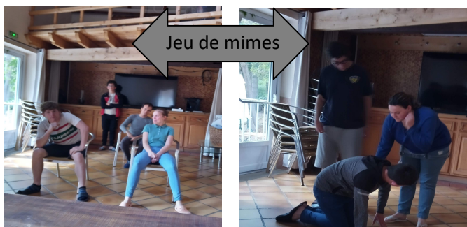
Jeu de mimes

Découvrir les régions de France : 1ere région « la Bretagne »